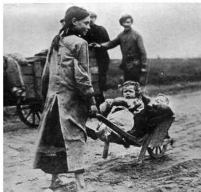
Gecompileerd door Jean Paul De Cloet Gent – Geschiedkundige Heruitgeverij - 2013

De vluchtelingen voor de eerste wereldoorlog