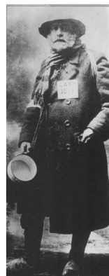
Gecompileerd door Jean Paul De Cloet Gent – Geschiedkundige Heruitgeverij - 2014

De geïnterneerden, gevangenen en opgeëisten tijdens de eerste wereldoorlog