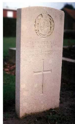
Gecompileerd door Jean Paul De Cloet Gent – Geschiedkundige Heruitgeverij - 2014